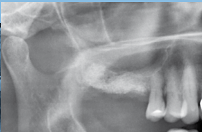
Ausschnitt aus postoperativem OPG

Der Patientin wurden unter Antibiose (3 Tage; Clindamycin) in Lokalanästhesie die Zähne 17 und 18 entfernt. Gleichzeitig wurde über einen lateralen Zugang eine Mukozele ausgeschält. Der laterale Defekt wurde mit einer SIC b-mem gedeckt. Parallel dazu wurden die Extraktionsalveolen in Regio 17, 18 zum Erhalt des Knochenvolumens im Sinne einer «socket seal surgery» mit SIC b-oss augmentiert und mit der bis in den palatinalen Bereich extendierten Membran abgedeckt. Die palatinalen und bukkalen Knochenanteile stellten sich intraoperativ als ausreichend stabil und voluminös dar.